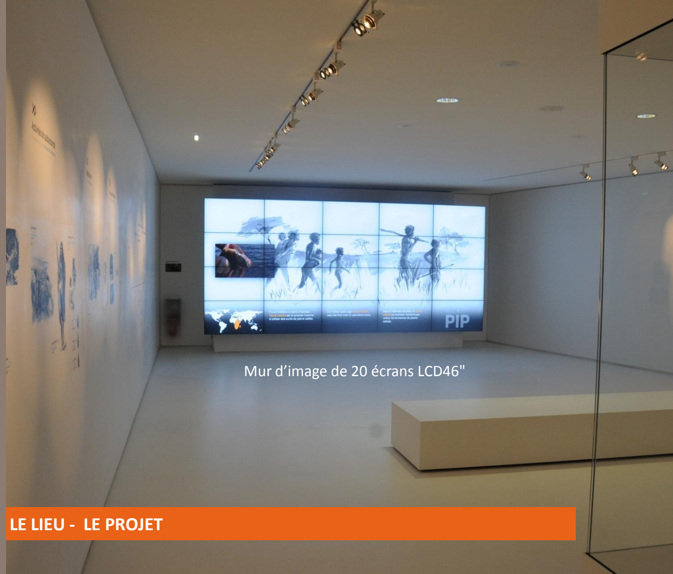
Mur d'image de 20 écrans LCD46"